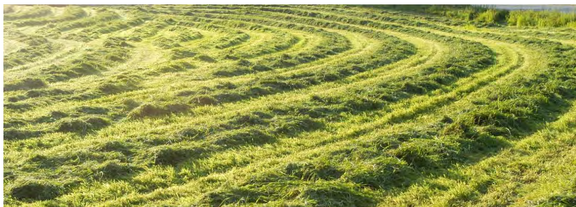
Bilde 16 Smittevernplanen skal omfatte alle deler av driften. Sjekker du opprinnelse og kvalitet på innkjøpt fôr?

En smittevernplan kan være nyttig i arbeidet med å hindre smitte til egne dyr og til besøkende i dyreholdet, også i dyreparker og sirkus, og ikke minst på besøksgårder, der de besøkende har tettere kontakt med dyra på gården.